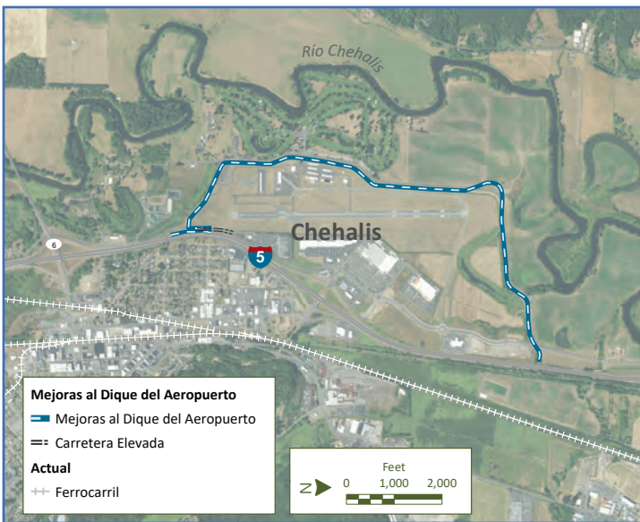
Mejoras al Dique del Aeropuerto Chehalis-Centralia